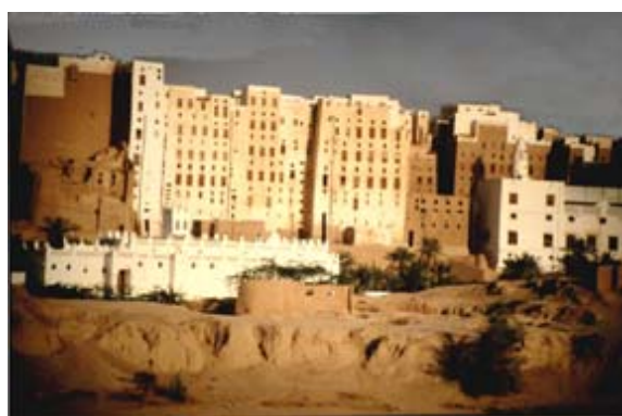
Seiyun, wadi Hadramaut (Yemen)

La escena transcurre aproximadamente en 1592, en alguna ciudad del wadi Hadramaut, en Yemen, y los sorprendidos occidentales son dos jesuitas apresados por los turcos en 1590, cuando viajaban desde la colonia portuguesa de Goa, en la India, hacia occidente intentando llegar a las costas de Etiopía. Los dos son españoles, uno se llama Antonio de Montserrat, y el otro Pedro Páez, castellano para más señas. Gracias a éste último y a las crónicas que escribió sobre sus viajes conocemos, entre otras muchas cosas, este episodio, el primer encuentro de un occidental con el café del que se tiene noticia.