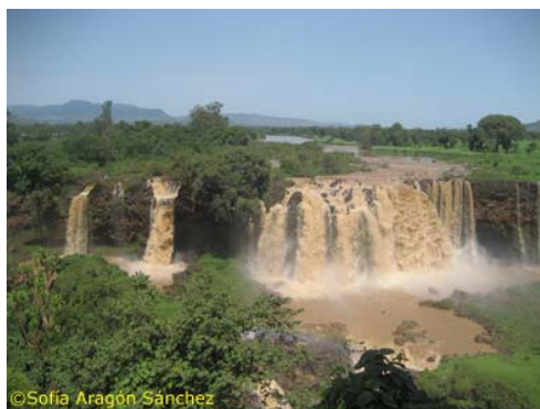
Las fuentes del Nilo Azul

Pedro Páez Jaramillo, nació en Olmeda de las Cebollas, el actual Olmeda de las Fuentes (Madrid). Vivió su vocación jesuítica como un impulso para llevar la fe a los lugares más apartados, imbuido por el espíritu misionero de San Ignacio y San Francisco Javier, pero incorporando a ello un afán aventurero y un dominio de la diplomacia que le hizo lograr una de las vivencias más fascinantes que ser humano alguno, de su época e incluso de la actual, pudiese imaginar. Después de muchas vicisitudes consiguió llegar a Etiopía, y allí no solo mantuvo en pie la pequeña misión que los jesuitas habían instalado varios años antes, sino que se granjeó la confianza del rey etíope y logró su conversión al catolicismo, y por ende la de todo el país, al menos de manera oficial. Hay que hacer un importante esfuerzo para recrear cómo debía ser la vida de un occidental en el corazón de África en el siglo XVI, pero no cabe duda de que sería durísima. Pensar en una pequeña comunidad de jesuitas rodeados de gentes coptas a las que tratan de atraer a la fe de Roma, en unas condiciones climáticas muy difíciles y rodeados de peligros de todo tipo, sorprende e incluso asombra bastante. Aunque reflexionando con un poco de calma, quizá las condiciones de vida del reino etíope no fuesen tan diferentes en esos tiempos de las habituales en la Castilla de la época. Es posible que la gran diferencia que ahora existe sea más un fruto de nuestro siglo.