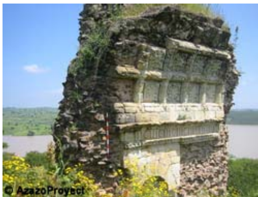
Los restos de la iglesia de Pedro Páez en Górgora

Pese a todo, Páez no tardó en entrar en contacto con el rey etíope, Za Dengel, venciendo pronto las numerosas reticencias que la corte tenía hacia los monjes gracias a su diplomacia y al respeto que mostraba con las creencias y costumbres locales. En poco tiempo había aprendido amárico y ge'ez, las principales lenguas de Etiopía, lo que le facilitó mucho el trato con los etíopes y el conocimiento de sus costumbres. Las relaciones con el rey se hicieron tan fuertes que el jesuita logró la conversión del monarca al catolicismo. Sin embargo la precipitación de éste al intentar imponer su nueva fe en todo el país, pese a los consejos de Páez, provocó una revuelta que acabó con su vida.