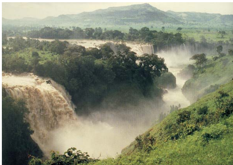
Las cataratas del Nilo Azul poco después de salir del lago Tana (Etiopía)

toma el agua, primero a oriente, luego al norte como si hubiese encontrado su camino hacia el mar, para cambiar de nuevo al este y entrar con fuerza en el lago Tana, donde se remansa un tanto. Abandona por el sur la gran laguna y va aumentando su caudal hasta dejarse caer por las cataratas de Tisisat, de las que Páez incluso calcula anchura y altura. Como si se tratase de un geógrafo avezado consigna en su libro los lugares que va atravesando el río mientras se adentra por gargantas estrechas, hasta que definitivamente se orienta al norte siguiendo imparabile hacia su destino a través del gran desierto.